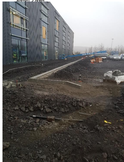
Byrjað á kantsteini við bílastæði á suðurhlíð